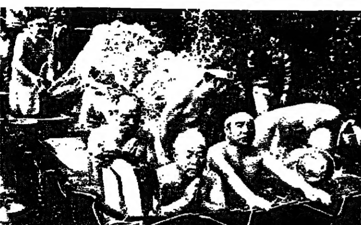
قامت مجموعة من حواي ١٥ بايفانيا بالاشتراك في مسابقة خاصة اقيمت في طوكيو لاختبار المتانة الجسدية. فقد صعد هؤلاء مدة ١٥ دقيقة داخل حوض مليء بماء البارد، وقطع الحديد بحيث ظلت حرارته تتجاوز الصفر، وبالطبع كانت الجائزة الاولى لآخر الخارجين حياً من الحوض (ب. راديو خاص).